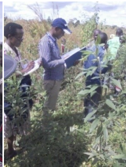
Réinsertion familiale en commune Mugamba Mise en exécution d'un jugement dans la commune Kibago pour récupérer un lopin de terre des orphelins