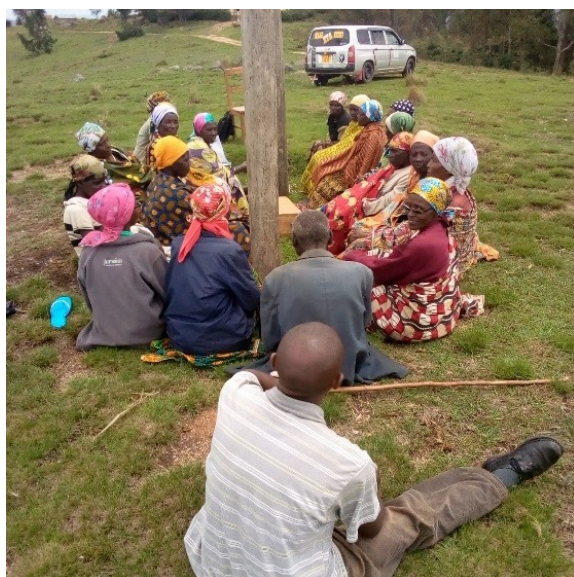
Les membres d'un groupe de solidarité dans une réunion Nawe Nuze

La pauvreté dans laquelle vit la majorité des familles au Burundi est le plus grand obstacle à l'épanouissement des enfants. C'est la raison pour laquelle la FVS- Amis des enfants a facilité la création des groupes de solidarités pratiquant le système d'épargne et de crédit « Nawe N'Uze » incluant l'épargne pour la prise en charge des OEV. A travers ces groupes de solidarité ; les membres bénéficient de formation en entrepreneuriat et d'accompagnement pour la réussite de leurs activités génératrices de revenus ainsi que d'autres formes de renforcement des capacités (santé, nutrition, etc....).