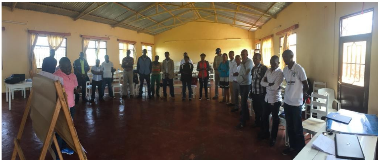
Formation des animateurs sociaux de FVS-AMIS DES ENFANTS sur le modèle FCAP à Matana

L'acquisition de ce logiciel Comm care a beaucoup facilité le suivi des activités mises en œuvre par l'organisation.