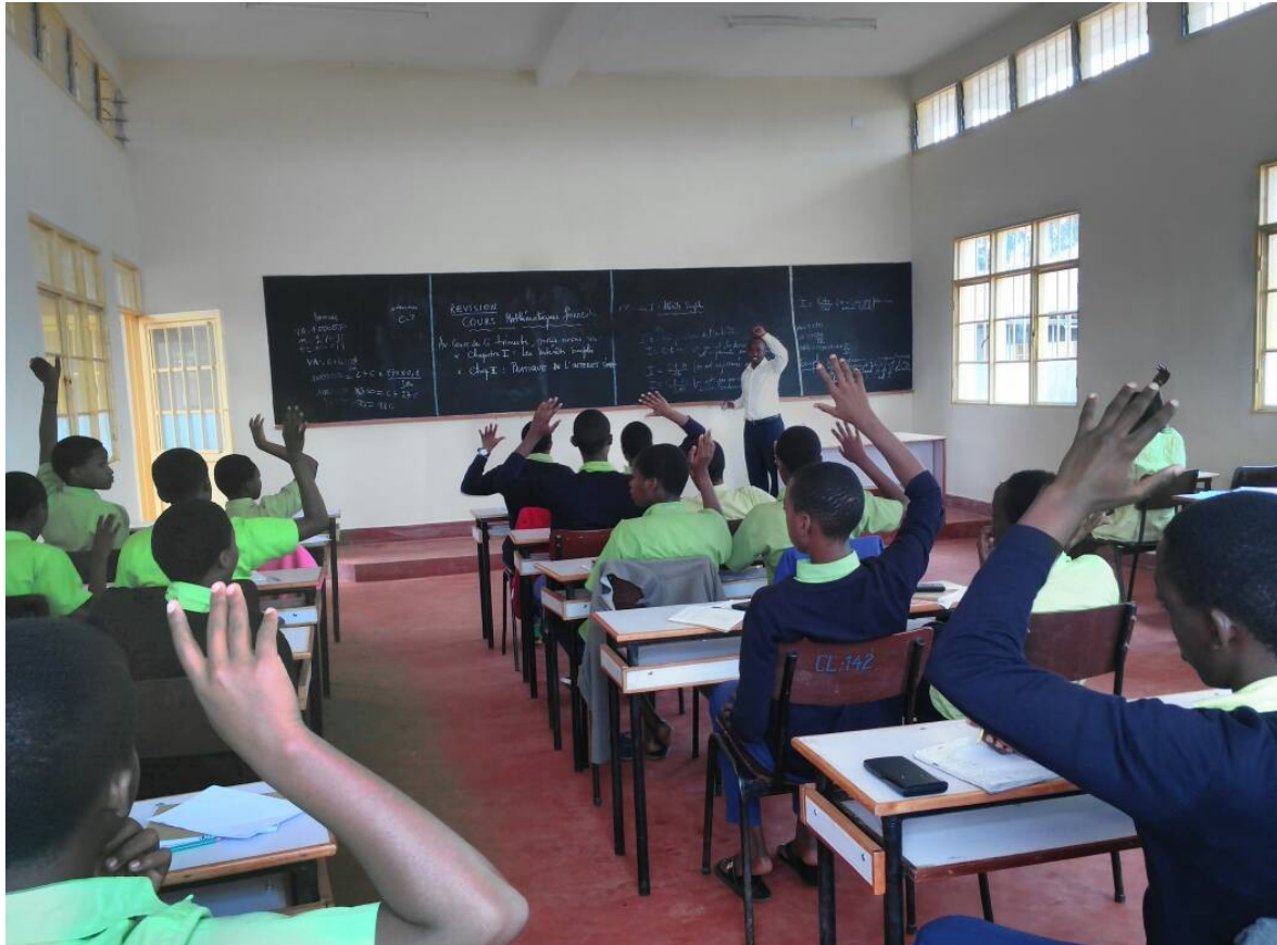
Des élèves en classe à l'Ecole de Référence de Matana « Amie des Enfants »

En vue de renforcer la capacité en anglais des élèves, 68 élèves de la huitième année ont fait un voyage d'immersion en langue anglaise en Uganda pour une période de 3 semaines.