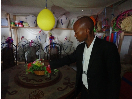
AGR de la coopérative «Umwana si uw'umwe » de Kanyosha : location du matériel de fête

Dans le but de pérenniser les actions de prise en charge des OEV réalisées par les groupes de solidarité; la FVS-Amis des enfants vient de franchir une nouvelle étape. Il s'agit de faciliter la transformation des groupes de solidarités déjà réunis dans les réseaux « Umwana si Uw'umwe », en coopératives multifonctionnelles. Ces coopératives ont une très forte mission sociale qui consiste à poursuivre les activités de prise en charge des OEV tout en réalisant des