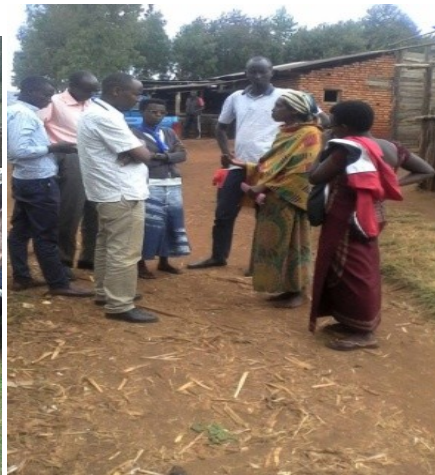
Photos de réinsertion familiale des OEV à Songa en province Bururi et à Buraza en province Gitega