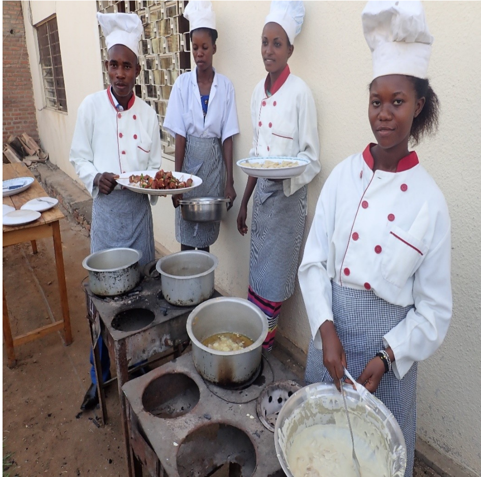
Des jeunes qui ont suivi une formation professionnelle en art culinaire

En plus de l'éducation formelle, 240 jeunes ont reçus des formations professionnelles en art culinaire, en soudure, en mécanique vélo-moto, en plomberie, en salon de beauté, en réparation des téléphones et en boulangerie et en art culinaire.